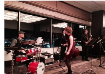
ブランスウィック社プレント社長

コンベンション2日目（10月7日）は、昨年那覇のコンベンションに B P A A パート・バーガー理事を招いて実施した、L T B（Bowling2.0）及び、リーグの講演会のフォローを目的として、パネルディスカッション形式で研修会を開催した。